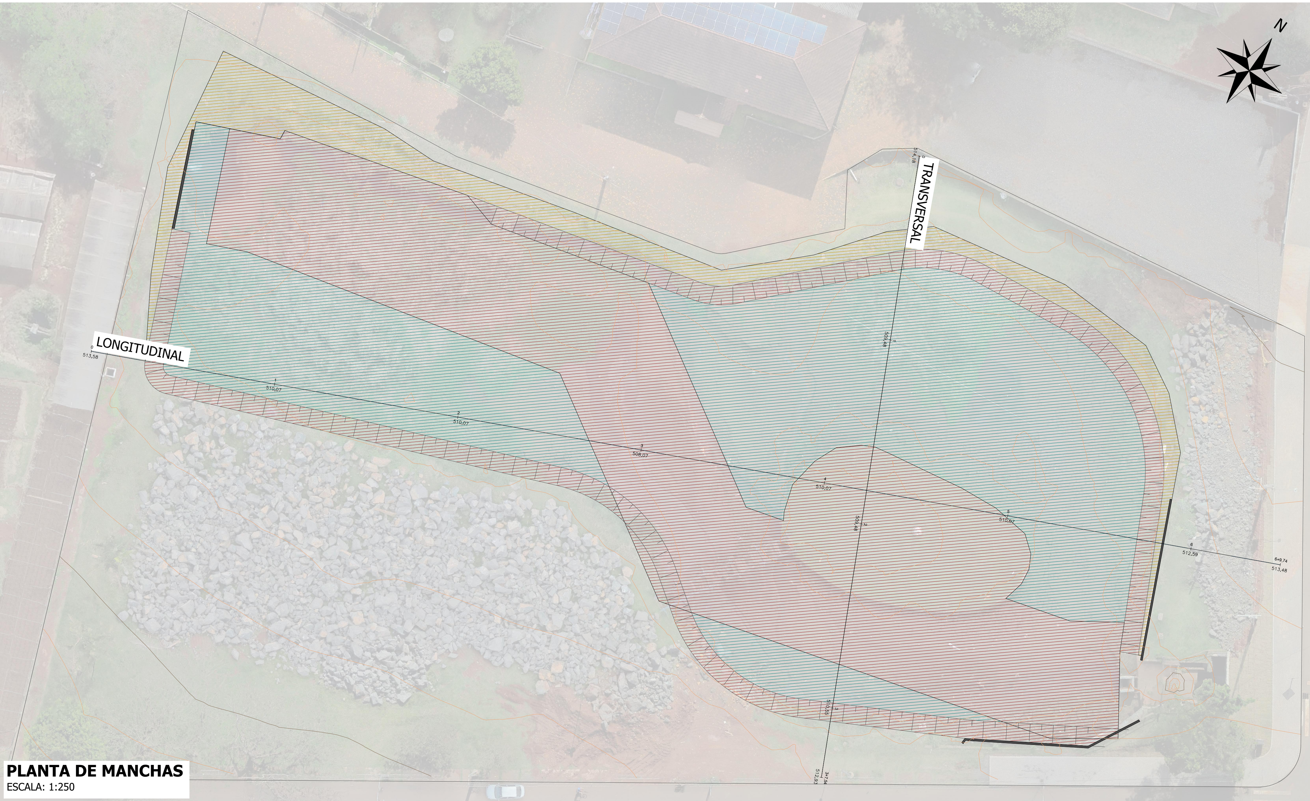
PLANTA DE MANCHAS ESCALA: 1:250